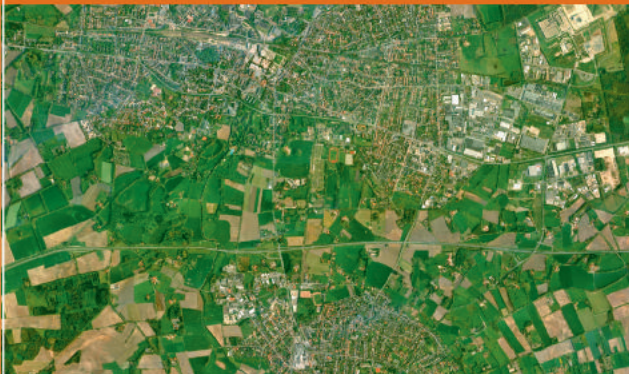
Die Pilotkommune Gronau – hier ein Ausschnitt – liegt im Norden des Kreises Borken