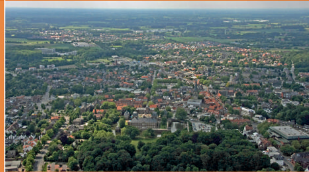
Pilotkommune Ahaus mit Schloss, Innenstadt und Ortsteil Willen

Das Projekt „Region in der Balance – Nachhaltiges Flächenmanagement im Kreis Borken unter Berücksichtigung von Klimaschutz und Klimaanpassung“ soll dazu beitragen, dass die Anforderungen der verschiedenen Akteure systematisch einbezogen und abgebildet werden. Gleichzeitig sollen Grundlagen und Kriterien entstehen, auf deren Basis Politik und Verwaltung Entscheidungen treffen können, die mittel- und langfristig die Zukunft der Region sichern.