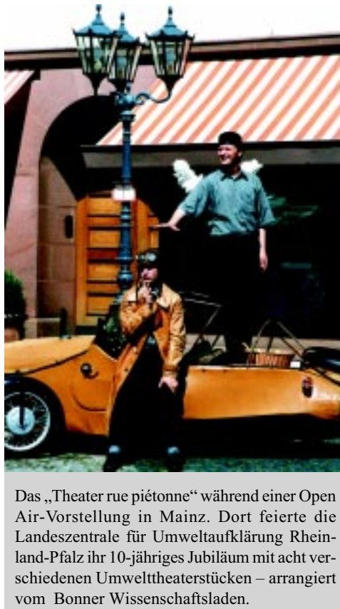
Das „Theater rue piétonne“ während einer Open Air-Vorstellung in Mainz. Dort feierte die Landeszentrale für Umweltaufklärung Rheinland-Pfalz ihr 10-jähriges Jubiläum mit acht verschiedenen Umwelttheaterstücken – arrangiert vom Bonner Wissenschaftsladen.

In diesem Jahr ist das Lernfest Teil einer weltweiten Aktion. Im Rahmen des „Globalen Dialoges“ der UNESCO werden auf der EXPO 2000 deutsche und internationale Lernfestbeispiele gezeigt.