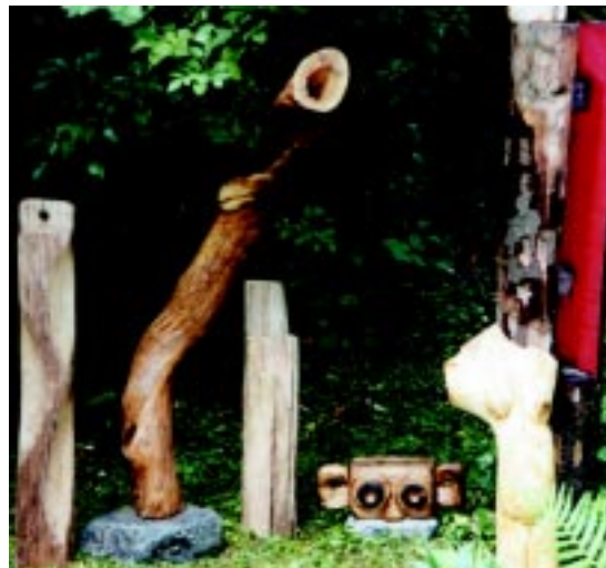
Die Verbindung von Natur und Kunst ist ein Förderfeld von Stiftungen

Stiftungen sind nicht nur finanzwirksame Akteure. Sie spielen zudem eine wichtige Rolle als Träger des „Sozialkapitals“ im gemeinnützigen „Dritten Sektor“ der Gesellschaft. Das gilt insbesondere für die Gemeinschafts- bzw. Bürgerstiftungen, die nach dem Vorbild der amerikanischen „Community