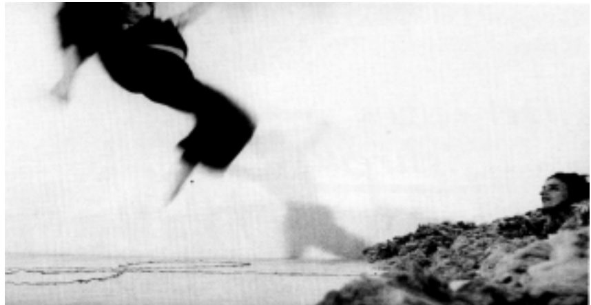
Monteure, Köln: Die Spinnweiber beim II. Umwelttheaterfestival.

Das Hamburger Theater Priessenthal wird mit „Maria Sibylla Merian - Die Frau vom 500 Markschein“ beim III. bundesweiten Umwelttheaterfestival in Bonn auftreten.